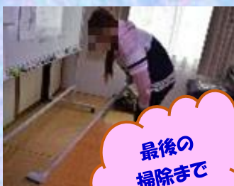
最後の掃除まできっちり

気が付けば「平成」最後の食事会でした。いつも通りにバタバタと作りましたが、それぞれ何をしよう・・・と考えながら動いてくれ助かりました！全体的に薄味な健康食？(笑)